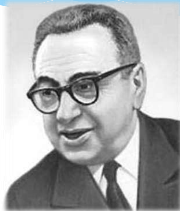
Автор музыки — Матвей Блантер