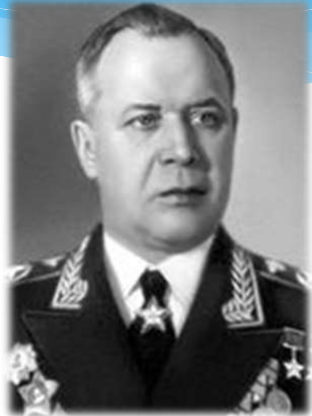
Автор музыки – Анатолий Новиков