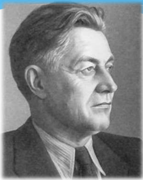
Автор слов - Алексей Сурков