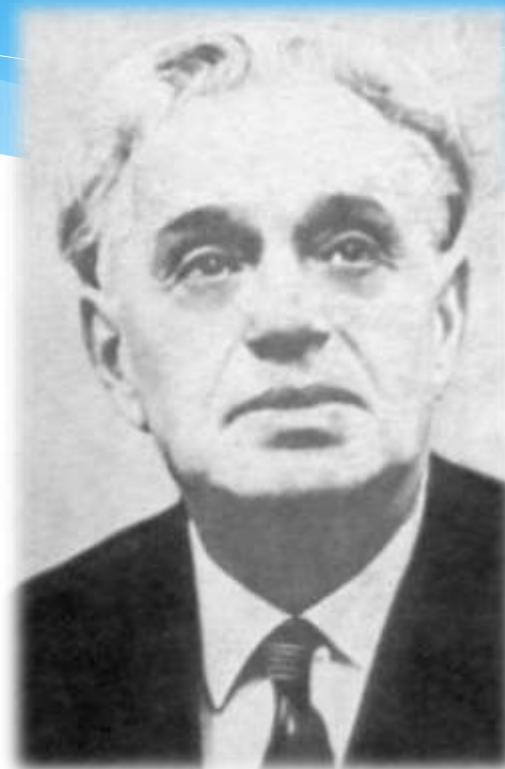
Автор музыки - Константин Листов