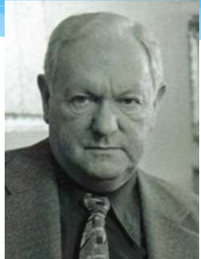
Автор музыки – Марк Фрадкина