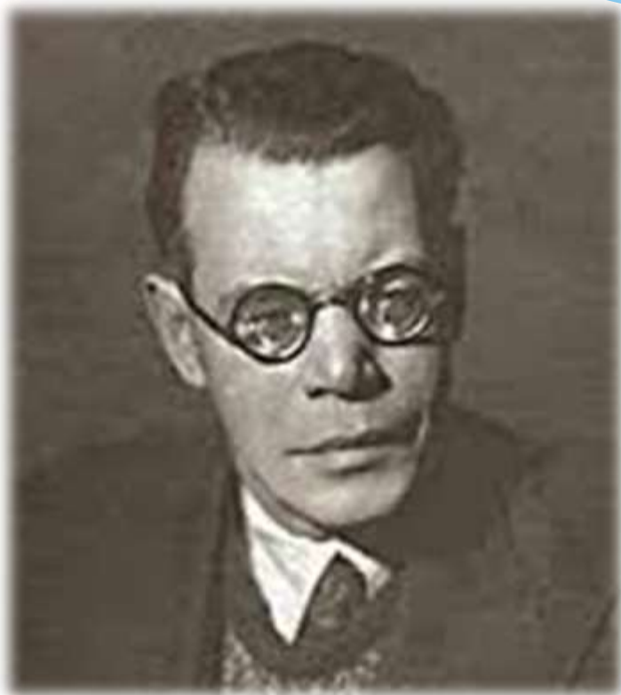
Автор слов — Михаил Исаковский