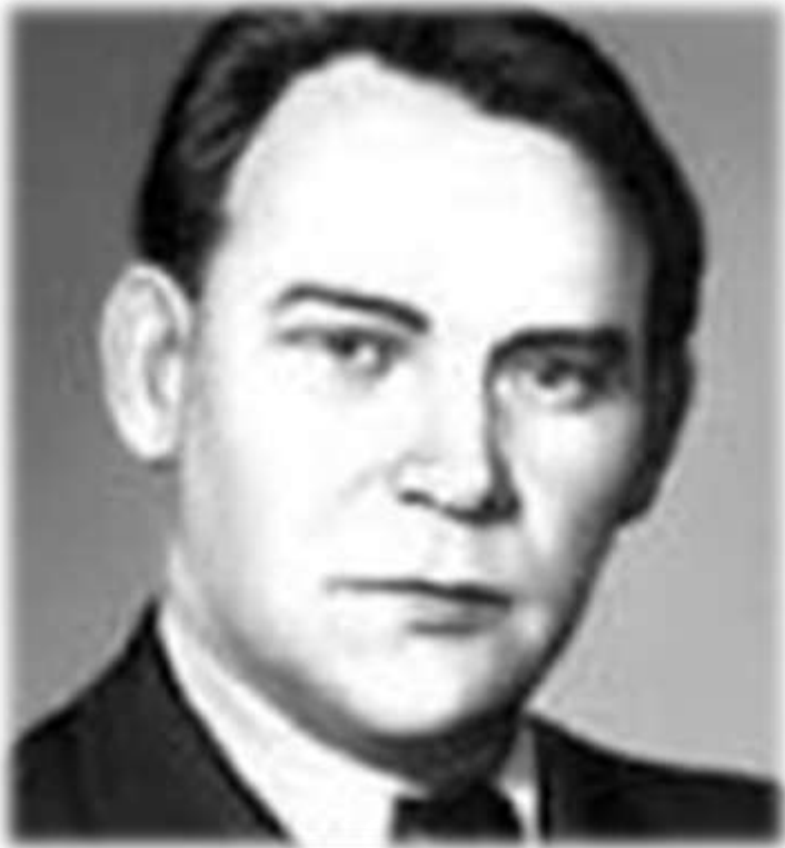
Автор слов-Лев Ошанин