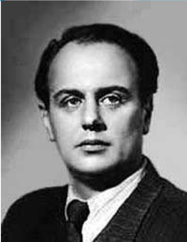
Автор слов – Евгений Долматовского